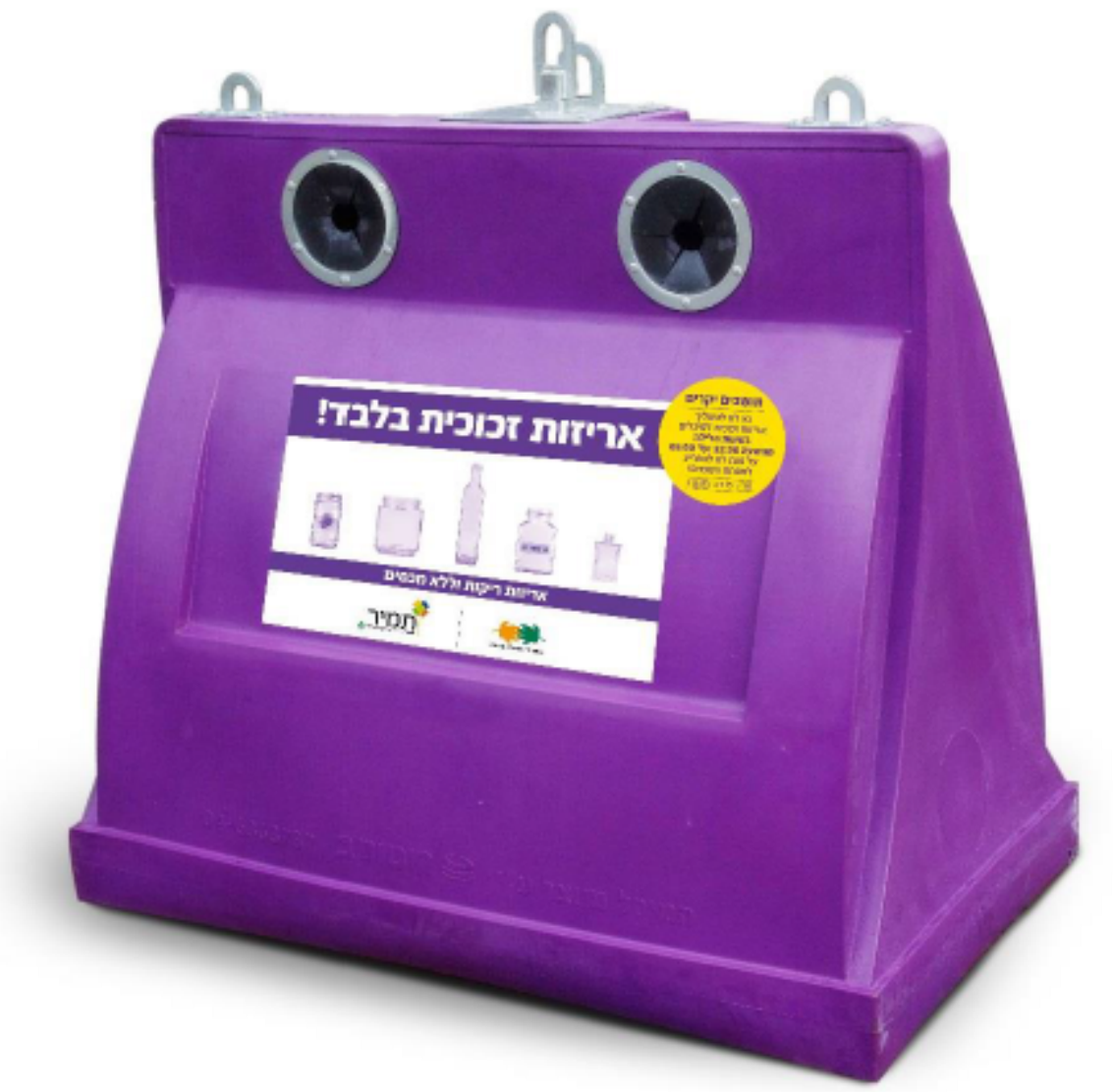
מיחזור זכוכית פח סגול ת.מ.י.ר. גובה 1420 מ"מ רוחב 1600 מ"מ עומק 1000 מ"מ

הערות א. כל פרטי הקונסטרוקציה והמצעים לפי קונסטרוקטור ב. גמר הבטון חלק - יש להשתמש בתבניות פורמייקה חלקות ללא סדקים ושכירות או בתבניות פלדה מתועשות מוטות הקשירה של התבניות יהיו מברזל מגולוון. לאחר שחרור התבניות הקוצים יחתכו 1 ס"מ בתוך הבטון ויאטמו במרק בגוון הבטון שיוחלק לאחר מכן את הבטון יש לצקת בוירציה בכדי למנוע כיסי אוויר ג. מצעים/החלפות קרקע ושברי אבן בהתאם לדוח יועץ הקרקע ד. יש להכין דוגמא לאישור המתכנן ה. תפרים לפי קונסטרוקטור