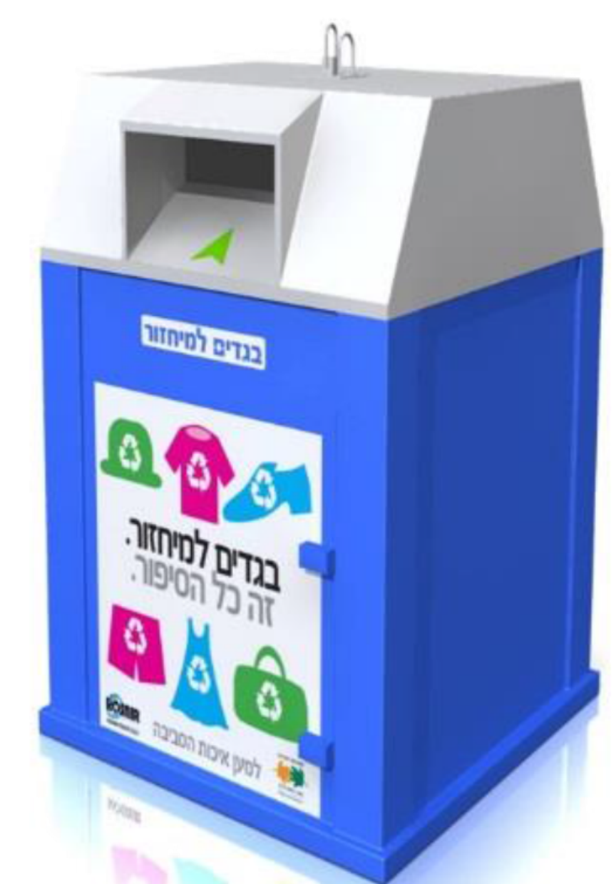
מיכל לאיסוף טקסטיל-רוזנר פח סגול ת.מ.י.ר. גובה 1800 מ"מ רוחב 1200 מ"מ עומק 1200 מ"מ עובי פח מגולוון 1.8 מ"מ מידות למדבקה רוחב ורוחב 85 מ"מ