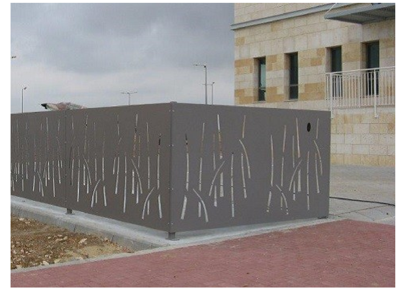
גידור היקפי גדר להסתרת מתחם אשפה - מתחמת 282 מצפיינים דפנות המתקן עשויות מתכת בעובי 2 מ"מ כל חלקי המתכת מגולוונים וצבועים בתנור בפוליאסטר נקי גוון צבע לפי דרישה ע"פ מפתח ר.א.ל. ולפי החלטת המתקן מידות מותאמות לתכנית