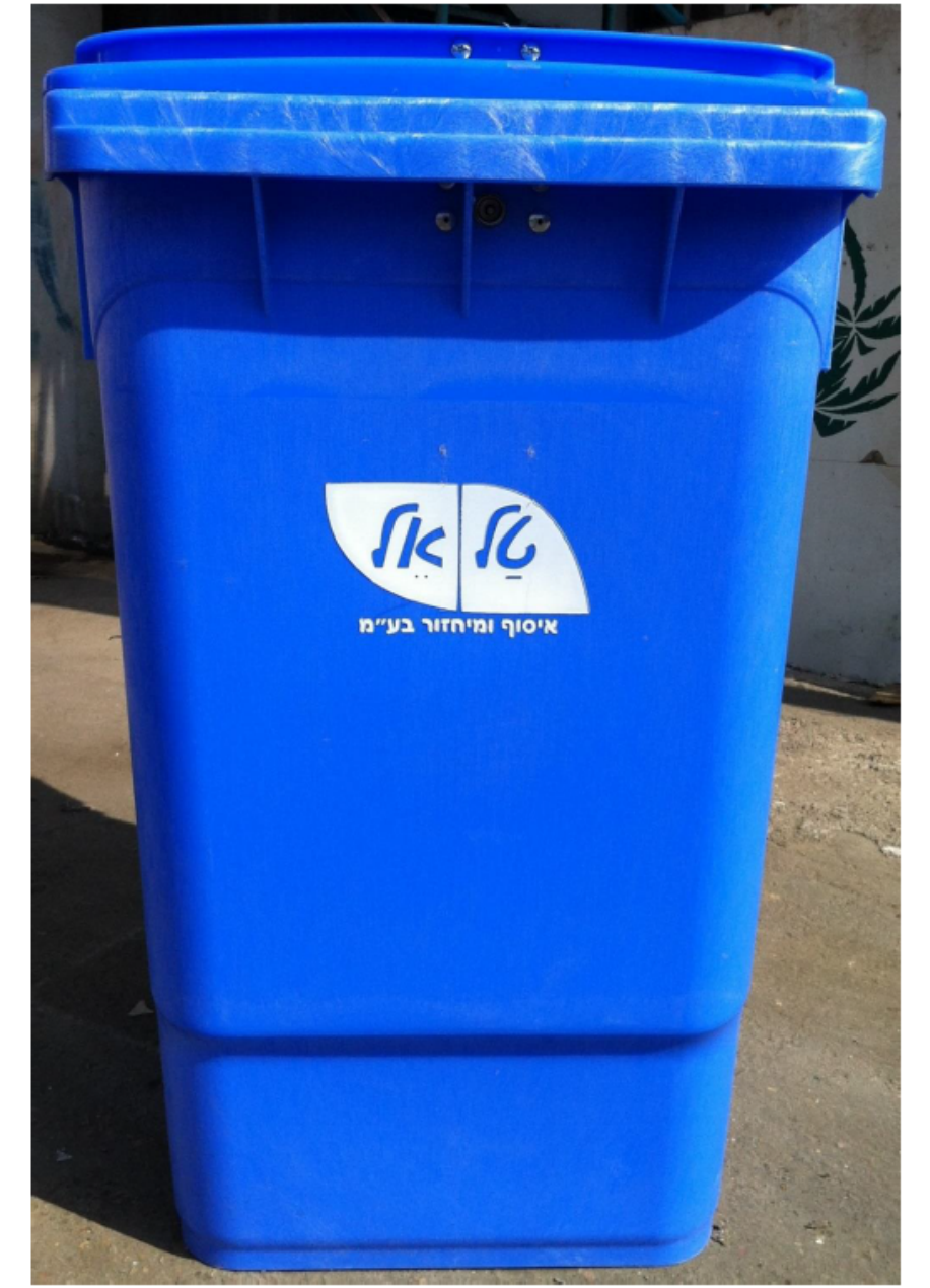
מיחזור נייר פח כחול טלאיל 360 ליטר גובה 1110 מ"מ רוחב 620 מ"מ עומק 872 מ"מ