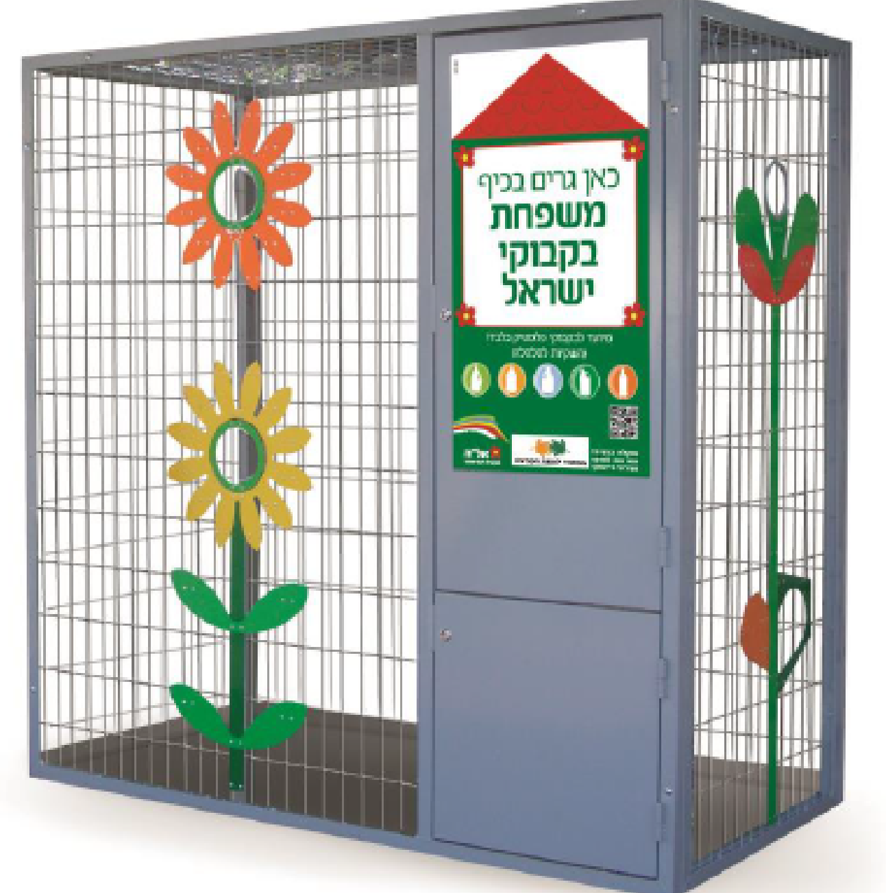
מיחזור בקבוקי פלסטיק גובה 2000 מ"מ רוחב 2000 מ"מ עומק 1000 מ"מ