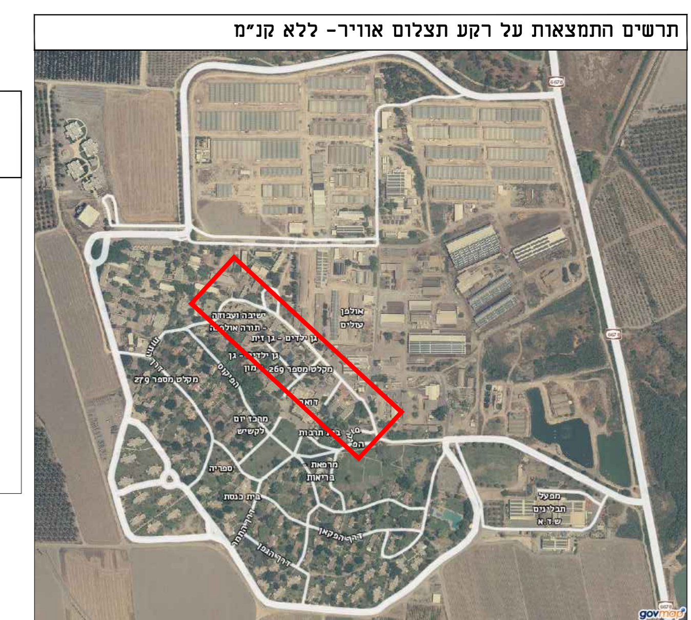
תחום התמצאות על רקע תצלום אווירי - ללא קניימ