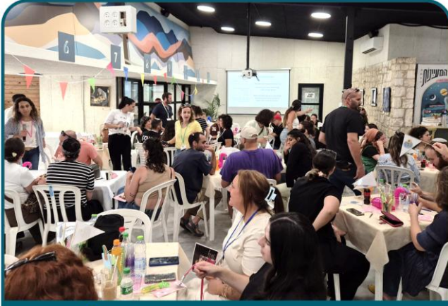
עושים חינוך חברתי-קהילתי

כנס החינוך החברתי ה-8 של עמק המעינות. מחלקת ילדים ונוער לא רק שומרת על הרלוונטיות שלה, אלא הולכת ומתחזקת משנה לשנה. סדנה, מפגש ויריד ספקים בהובלת 'מעברים מעיינות כנרת'.