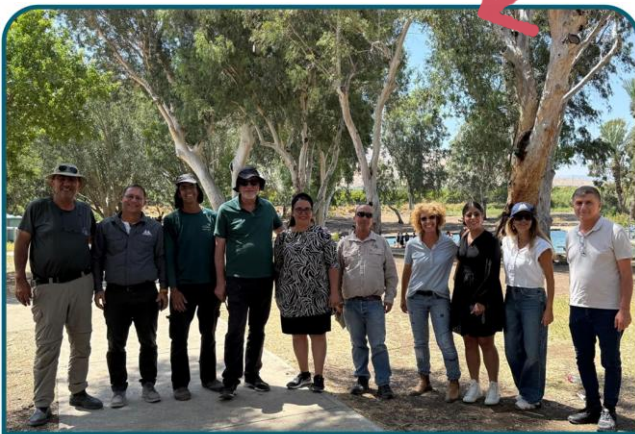
סיור משרד התיירות בפארק המעינות

Camp IOT מתקיים בעידן טכנולוגי זו השנה הרביעית. במהלכו כ-20 תלמידים מכיתות ח' מגאון הירדן ושקד, נכנסים לשבוע מרוכז של פיתוח מוצרים ייחודיים - הפעם לניטור נתוני הכושר של שחקני גלבוץ-גליל.