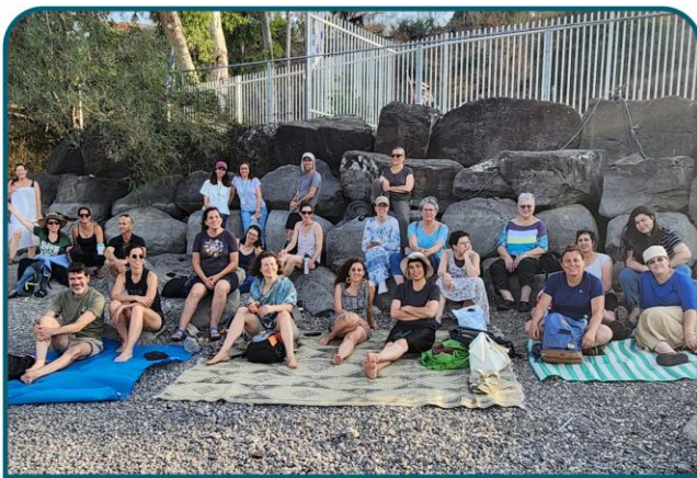
עושים חינוך סביבתי

לקחנו חלק מרכזי בסמינר הארצי של מנהלות תחום החינוך הסביבתי ברשויות המקומיות והצגנו שני פרויקטים ייחודיים: "מבטבע" - פרויקט חינוכי מקומי שמחבר בין טבע וקהילה, וקורס הפעילים הסביבתיים.