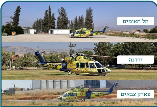
תרגילי נחיתה של מד"א

החל מ-3:00 לפנות בוקר הופעל מרכז ההפעלה בחירום של המועצה, כדי לתת מענה לכל תרחיש ביטחוני. צוותי המועצה והביטחון במוכנות ובכוננות. מאחלים הצלחה לכל כוחותינו.