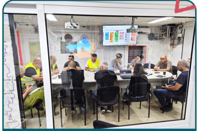
מצב מיוחד בעורף

כנס החינוך החברתי ה-8 של עמק המעינות. מחלקת ילדים ונוער לא רק שומרת על הרלוונטיות שלה, אלא הולכת ומתחזקת משנה לשנה. סדנה, מפגש ויריד ספקים בהובלת 'מעברים מעיינות כנרת'.