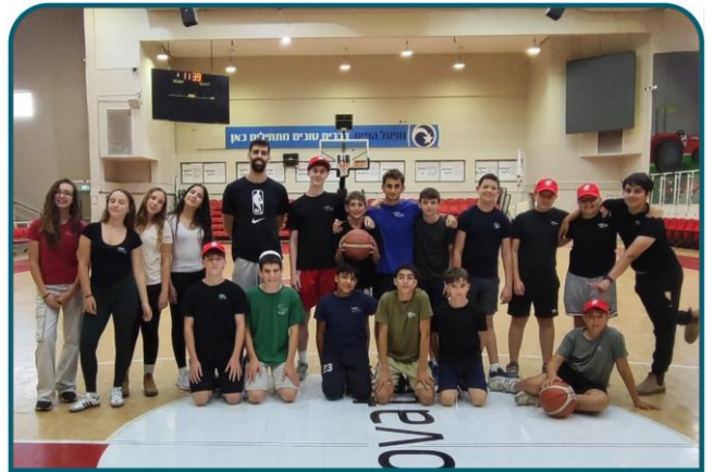
אתגר פיתוח וחדשנות בעידן טכנולוגי

'מגן דוד אדום' ביצעו תרגילי נחיתה במנחתים ברחבי העמק, כחלק מהמוכנות השוטפת לתרחישי פינוי פצועים בשעת חירום.