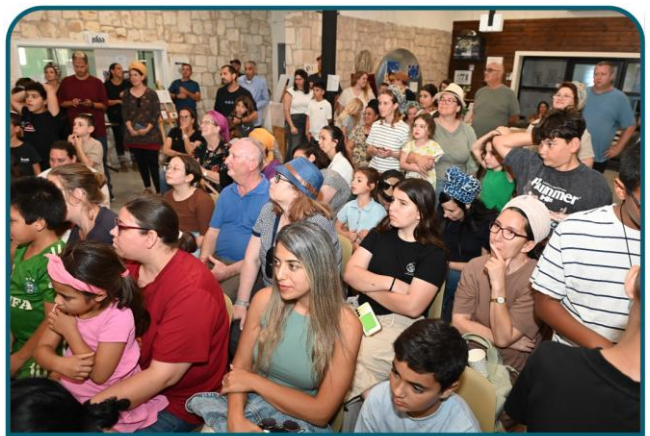
התערוכה השנתית של 'פותחים עתיד'

לקחנו חלק מרכזי בסמינר הארצי של מנהלות תחום החינוך הסביבתי ברשויות המקומיות והצגנו שני פרויקטים ייחודיים: "מבטבע" - פרויקט חינוכי מקומי שמחבר בין טבע וקהילה, וקורס הפעילים הסביבתיים.