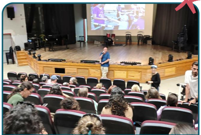
מתכוננים לקיץ בטוח

פירחית ייסדה את החווה החינוכית לפני 13 שנים והביאה אותה, בשיתוף פעולה עם המו"פ שלנו, להיות הקסם החינוכי שהיא היום, עם 1,200 תלמידים שמגיעים אליה מידי שבוע לפעילות לימודית.