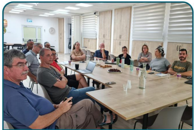
משלבים כוחות - לביטחון יישובי הגלבוץ

סיור משמעותי בפארק המעינות של הצת"פ (צוות תכנון ופיתוח) של משרד התיירות, עם מינהלת הפארק, להמשך פיתוח והנגשה של הפארק לכלל הציבור.