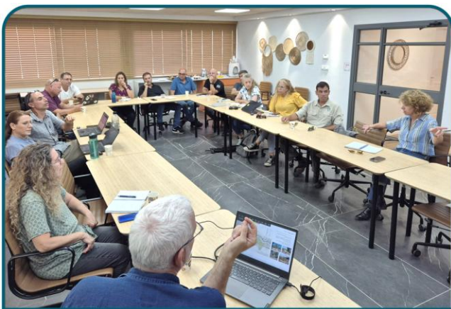
פגישת עבודה עם קק"ל על פרויקטים חדשים

התערוכה השנתית המסורתית של ילדי 'פותחים עתיד' בעמק המעינות. בהשראת הספר "טביעת האצבע של אייל" תוצרי התערוכה עסקו בייחודיות ובעוצמות של כל ילד. בטקס מרגש נפרדנו מבוגרי התוכנית.