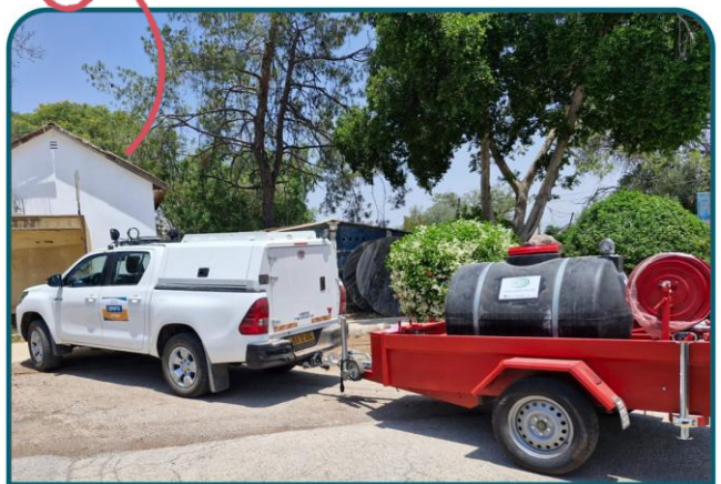
גרורי כיבוי לכל יישובי המועצה

צוות עמק המעינות שעוסק בניהול השטחים הפתוחים, נפגש עם אנשי קק"ל לסקירה על כלל התוכניות המשותפות שיוצאות לתכנון וביצוע בשנים הקרובות. עובדים על אתרים חדשים ומעניינים בעמק!