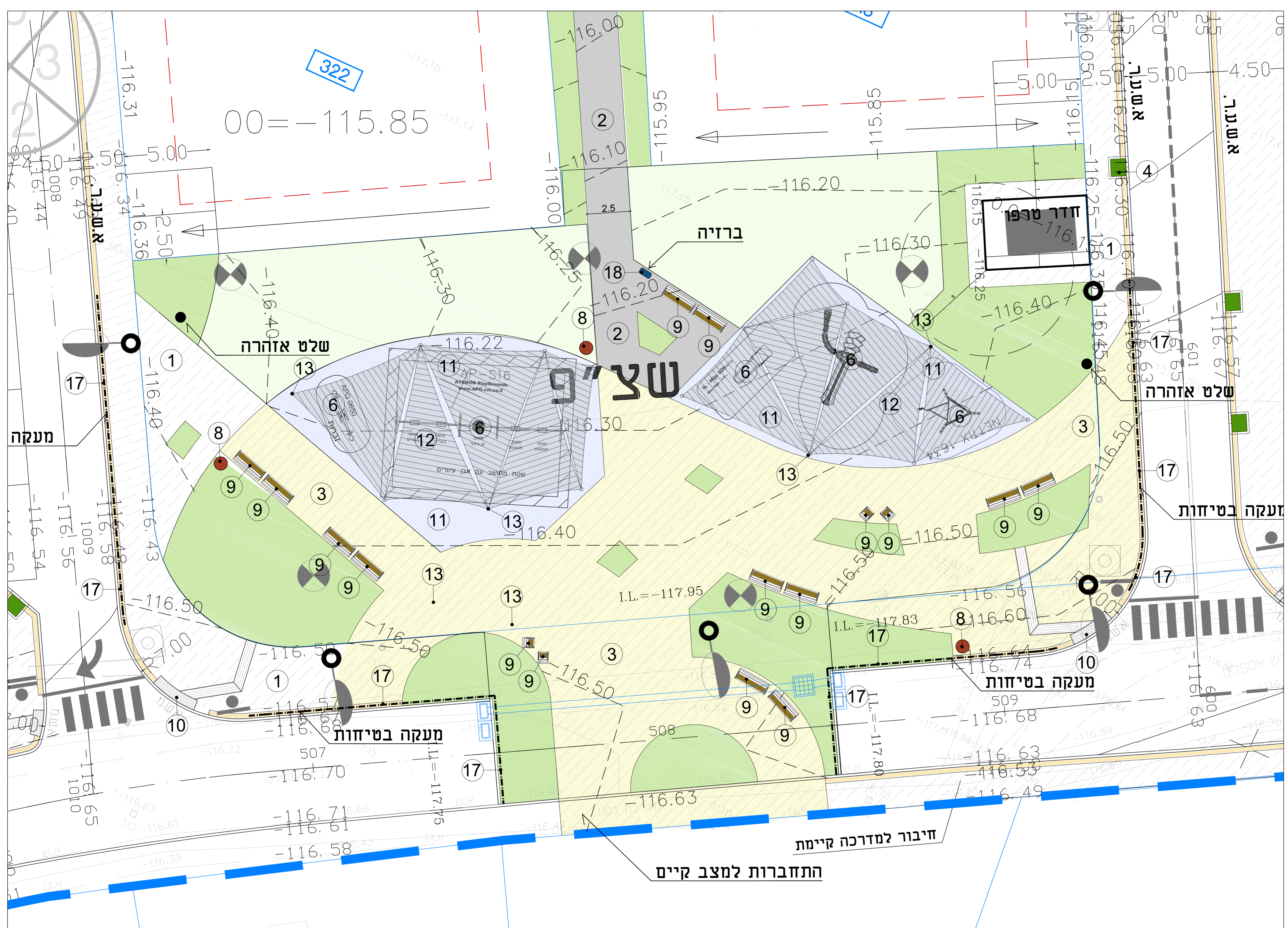
תכנית 01, קנ"מ: 1:100